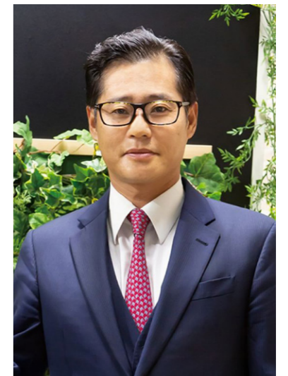
株式会社ナインツリーホールディングス 代表取締役社長